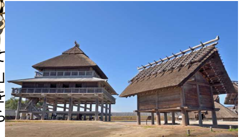
吉野ヶ里歴史公園「北内郭・主祭殿と斎堂」