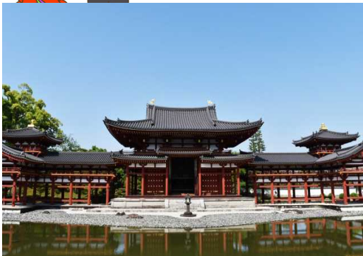
平等院鳳凰堂 宝池に浮かぶ宮殿のように、その美しい姿を水面に映しています。

飛鳥・奈良時代に入ると、朝鮮半島から建築技術が伝わり、同時に仏教も伝来したため、それまでには見られなかった寺院建築が発達しました。人々の住居は身分によって大きく異なり、身分の高い人はしっかりとした住居に住む一方、農民はまだ竪穴式住居に住んでいたようです。平安時代には「寝殿造」という建築様式が誕生しました。寝殿造とは、儀式や客人を呼ぶ寝殿を中心とし、左右対称に家屋を繋げる豪華な屋敷のことです。代表的な建築物としては平等院鳳凰堂(10円玉の絵柄)ですね！