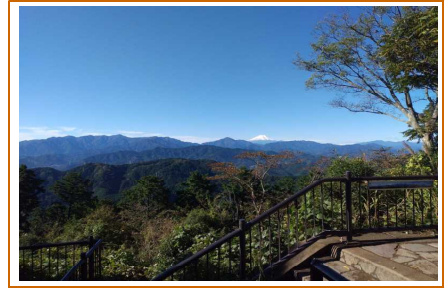
【山頂から富士山を望む】

高尾山にはいくつかの登山道がありますが最もおすすめなのが「6号路」と呼ばれる登山道です。ロープウェイ駅から15分ほど歩いたところにある登山口から沢沿いの気持ちの良い登山道が続きます。自然に溢れ、東京にいながら様々な動植物に触れ合うことが出来ます。数ある登山道の中でも最も勾配が緩やかで無理なく歩ける点もおすすめです。山頂までのコースタイムは約90分です。